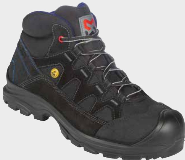
ČIERNÁ M021021 ...