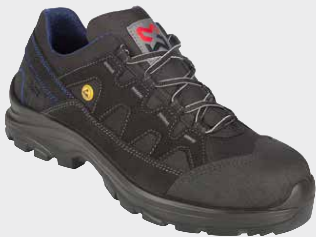
ČIERNÁ M417013 ...